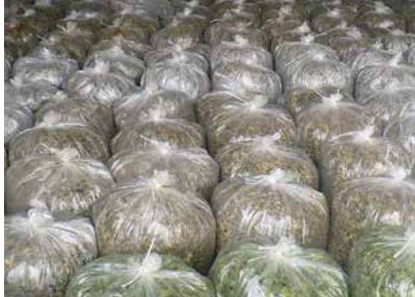
Bolsas llenas con ensilaje

Como se mencionó antes, el proceso de ensilaje requiere de azúcares y bacterias. Normalmente estos se agregan en forma de diversos aditivos en la etapa de llenado y compactación cada vez que se agrega una capa del forraje. La cantidad a agregar de azúcares depende del forraje, sin embargo, en términos generales se debe agregar entre 3 y 6 kg de melaza por cada 100 kg de forraje a ensilar.