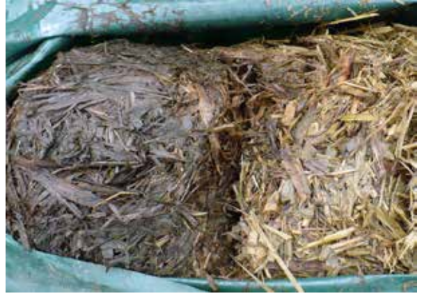
Silo dañado por rotura de bolsa

El proceso de conservación o almacenamiento consiste en la etapa requerida para que se dé la fermentación del material. Este puede requerir entre 30 días para materiales como maíz y sorgo y hasta 60 días para pastos y subproductos. Para esta etapa, se debe mantener el área en condiciones adecuadas de tal forma que el forraje logre alcanzar la acidez requerida. Si durante esta etapa hay ingreso de aire al forraje, la fermentación no se dará como se espera y el forraje se va a descomponer.