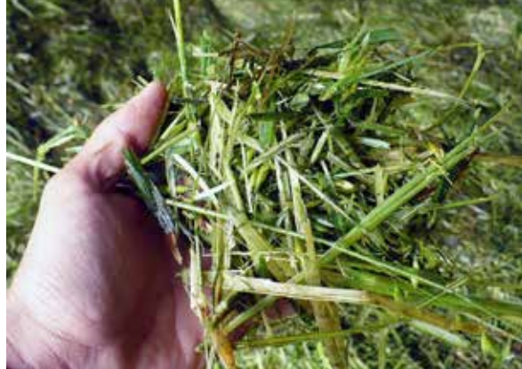
Avena forrajera en fresco previo al ensilaje

Debido a que el ensilaje mantiene la mayoría de las características del forraje utilizado, éste se debe cosechar a una edad adecuada que permita un aporte adecuado de nutrientes a los animales.