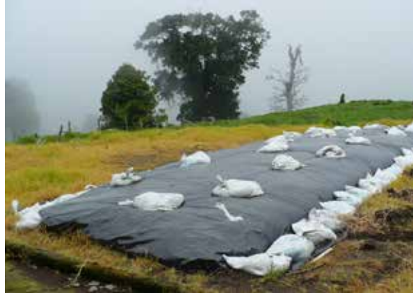
Silo de montón de avena forrajera

Una vez listo el forraje, se procede al llenado de la estructura donde se guardará. Existen diversas estructuras (silos) que se pueden utilizar: