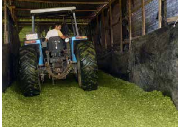
Llenado de ensilado

La palabra ensilaje es sinónimo de fermentación. Existen diferentes procesos de la vida cotidiana en los que usamos algún tipo de fermentación: