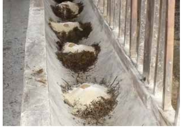
Ensilado de avena en comedero

Una vez transcurrido el tiempo de conservación, se procede a abrir los silos. Se debe tener en cuenta que, dependiendo de la estructura usada, no se va a utilizar todo el ensilaje en un mismo día para alimentar los animales. Por lo tanto, recuerde sacar lo requerido y volver a cubrir bien el material en el silo. En esta etapa, suelen haber muchas pérdidas por mal cierre del silo, pues cada vez que se saca ensilaje para alimentar, se está dando ingreso de aire que puede descomponer el forraje.