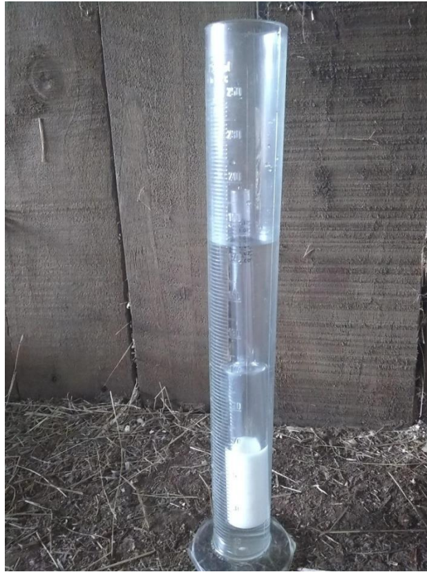
Figura 4. Medición de la calidad de calostro con el calostrómetro equino (Laboratorios Jorgensen, Loveland, Colorado).

Con el fin de valorar la técnica de refractometría para determinar la concentración de grados Brix en el calostro, se utilizó un refractómetro óptico (ATAGO ATC-1), con compensación automática de temperatura entre 10 y 35 °C con una escala hasta 32 grados Brix. Primero se realizó una medición con agua destilada para asegurar la correcta calibración del refractómetro y después de la limpieza del aparato se realizó la medida del calostro (Figura 5). La interpretación de los resultados obtenidos se realizó con la información proporcionada en el Cuadro 2.