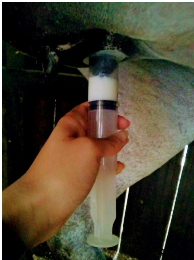
Figura 3. Obtención de las muestras de colostro por medio de las jeringas de 60 cc.

Para determinar la calidad del colostro se utilizó un calostrómetro equino (Laboratorios Jorgensen, Loveland, Colorado). Se obtuvo una muestra de colostro de 15 ml mediante el ordeño de los dos pezones de las yeguas y se colocó en el calostrómetro. Este instrumento fue introducido en una probeta plástica con agua destilada para realizar la medición de la calidad del colostro según la flotación del mismo en el agua (Figura 4).