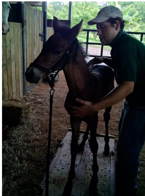
Figura 6. Pesaje de potro con la balanza móvil.

estimar la producción de leche de las yeguas, además se ha utilizado en cerdos para estimar el consumo de calostro (Doreau y Boulot 1989, Devillers et al. 2004, Mauro et al. 2005). Se realizó un seguimiento del crecimiento de los potros mediante el pesaje cada 15 días hasta las 6 semanas de vida (Figura 6). Durante cada visita a la finca se evaluó la salud general de los potros, anotando la presencia de diarreas o algún otro problema evidente.