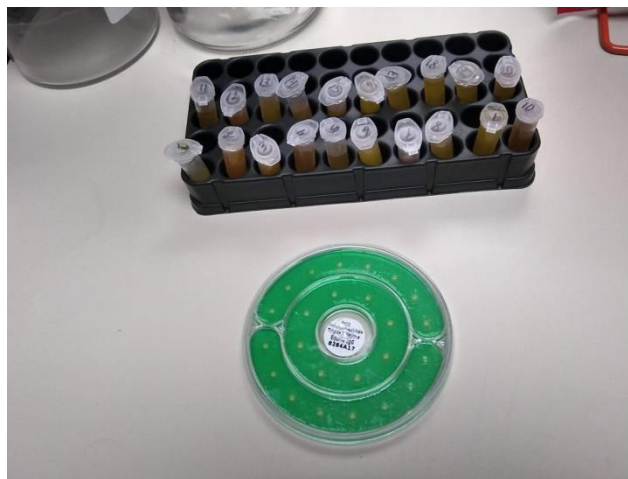
Figura 7. Microtubos con muestras séricas y kit de inmunodifusión radial.

fueron sometidas a un centrifugado de 3000 rpm durante 10 minutos para separar el suero (Hodge et al. 2016). Posteriormente, fueron divididas en 2 alícuotas para mantener una cantidad de muestras extra y se mantuvieron en congelación hasta que se dieron todos los partos. Luego de este periodo, fueron sometidas a descongelación para realizar la medición de la concentración de inmunoglobulinas G. Se utilizó el método de inmunodifusión radial (Equine IgG Test Kit 200-3000 mg/dl Triple J Farms, Bellingham, WA) (Figura 7).