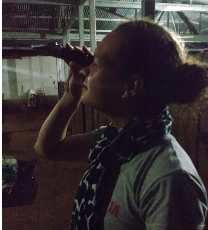
Figura 5. Medición de la calidad del calostro con el refractómetro (ATAGO ATC-1).

El calostro de las 20 yeguas en el estudio fue evaluado con el calostrómetro y refractómetro; sin embargo, con respecto a los resultados del calostrómetro no se puede contar con un dato debido a que en el momento en que se introdujo el calostrómetro en el agua destilada se hundió completamente, lo que condujo a la pérdida de la muestra.